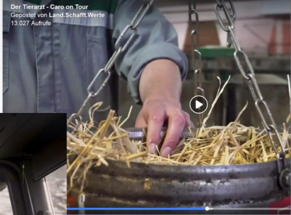
Der Tierarzt - Caro on Tour Gepostet von Land.Schafft.Werte 13.027 Aufrufe