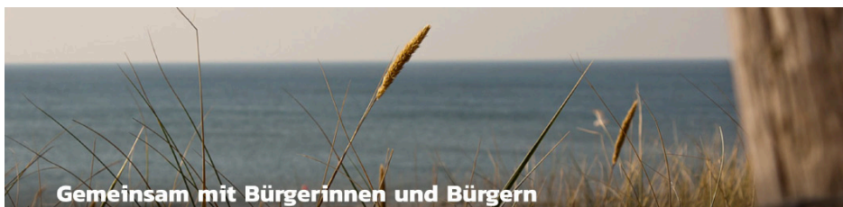
Gemeinsam mit Bürgerinnen und Bürgern