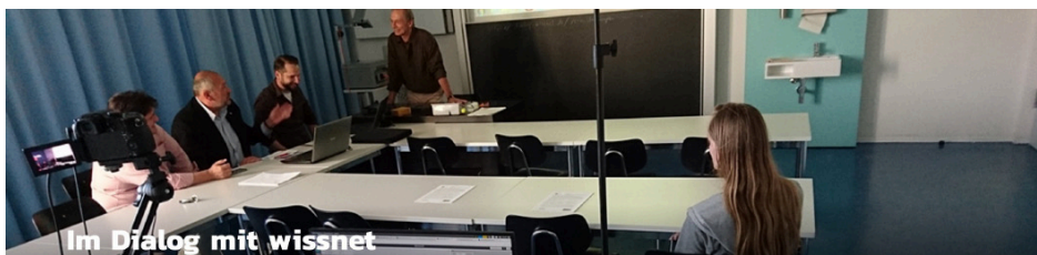
Im Dialog mit wissnet