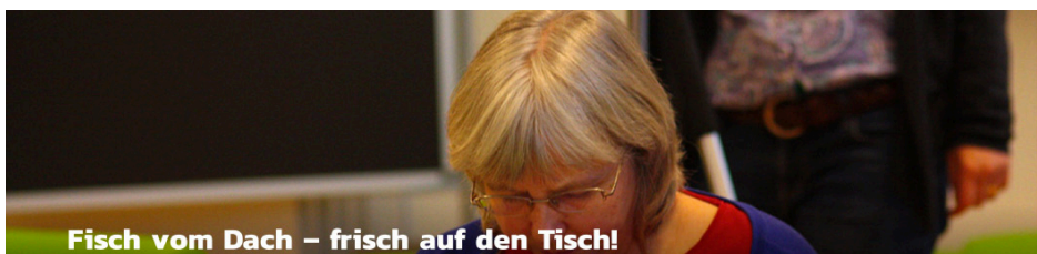
Fisch vom Dach – frisch auf den Tisch!