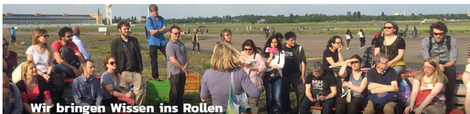
Wir bringen Wissen ins Rollen