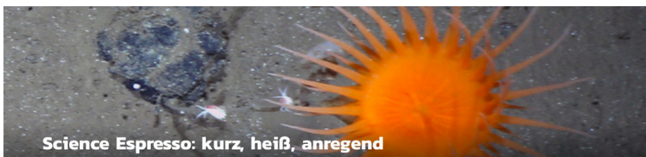
Science Espresso: kurz, heiß, anregend