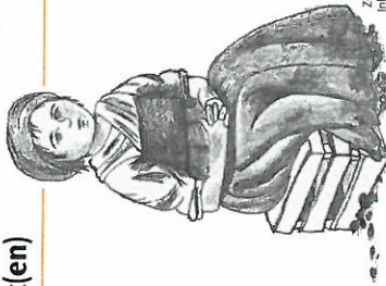
Zeichnung: Ina Schieck

17 Im Mittelpunkt dieser Unterrichtsidee steht die Motivfigur Lene, die aufgrund der ärmlichen Verhältnisse in ihrem Heimatdorf im Jahre 1870 mit ihren Eltern nach Amerika auswandern muss.