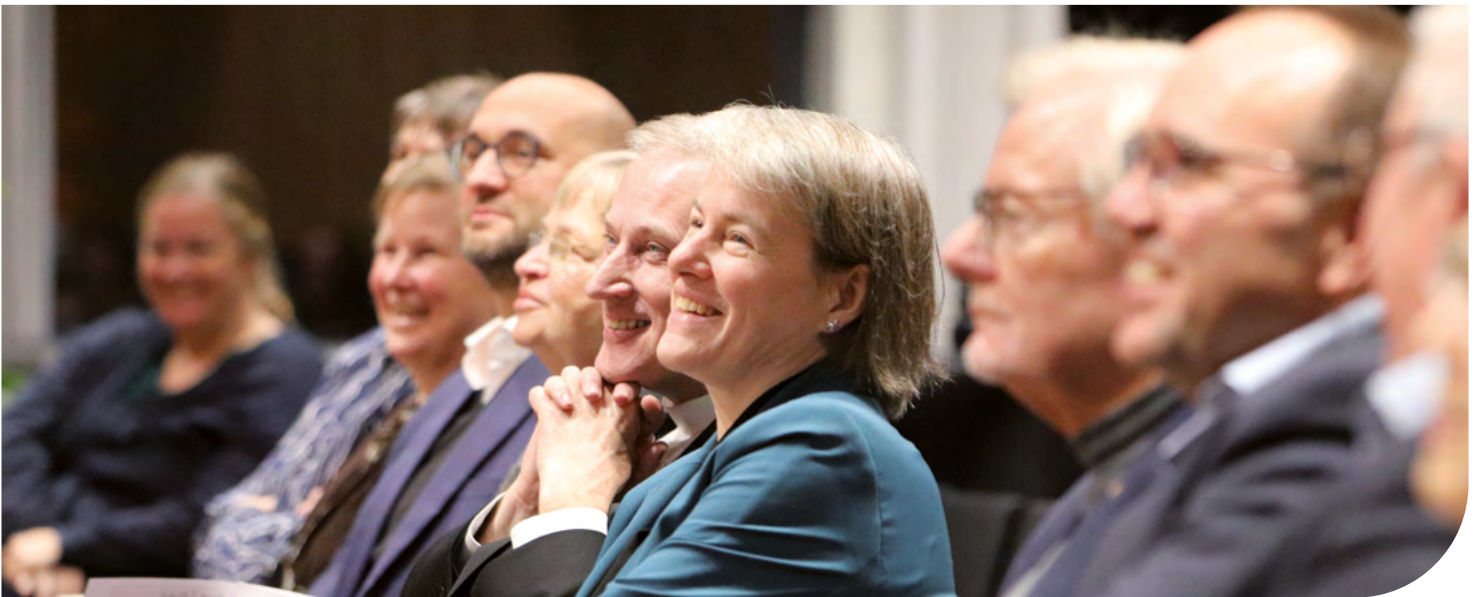
Gäste, Präsidium und weitere Hochschulangehörige bei der Eröffnung.