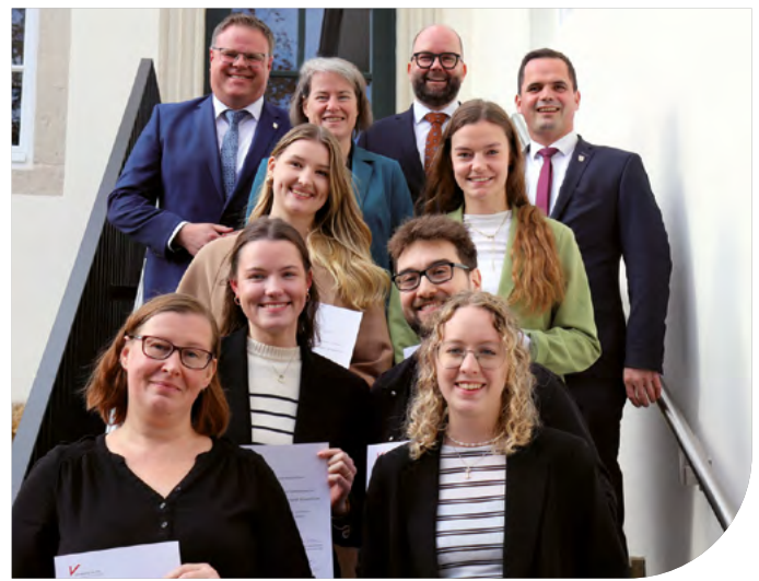
Stipendiat*innen mit Vertretern der stiftenden Institutionen.

Zu einer Premiere sind die Landkreise Cloppenburg und Vechta mit der Stadt Vechta zusammengekommen. Gemeinsam überreichten sie an sieben Studierende der Universität Vechta die ersten OM-Stipendien. Diese zeichnen neben den herausragenden studentischen Leistungen das ehrenamtliche Engagement im Oldenburger Münsterland aus.