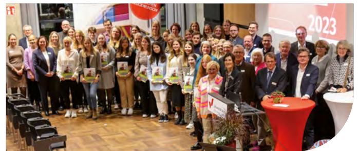
Fördernde mit Stipendiat*innen beim Festakt.