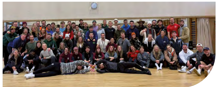
16 Fachschaften aus Niedersachsen und weitere Sportstudierende haben sich bei der Le VeFaTa ausgetauscht.

Die LandesfachschaftsTagungen finden jährlich statt, immer ausgerichtet von einem der beteiligten Fachräte. Dabei werden Sportstudierende zum Austausch über die Fachschaftsarbeit und das Sportstudium eingeladen. So auch bei der La VeFaTa, zu welcher neben den Vertreter*innen aus Niedersachsen auch Sportstudierende der Fachräte aus Kiel, Hamburg, Hannover, Oldenburg, Osnabrück, Göttingen, Hildesheim, Mainz, Gießen, Potsdam, Landau, Münster, Darmstadt, Bochum und Marburg nach Vechta kamen.