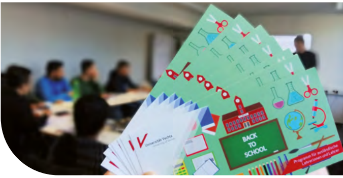
Stifterverband würdigt das Programm

Das „Back to School“-Programm des International Office an der Universität Vechta erhält durch den Stifterverband die Auszeichnung „Hochschulperle des Monats November“! Mit dem Titel würdigt der Stifterverband besonders innovative, beispielhafte Projekte an deutschen Hochschulen. Im Jahr 2023 stehen dabei Projekte im Fokus, die zeigen, wie zukunftsfähige und attraktive Lehrkräftebildung aussehen kann.