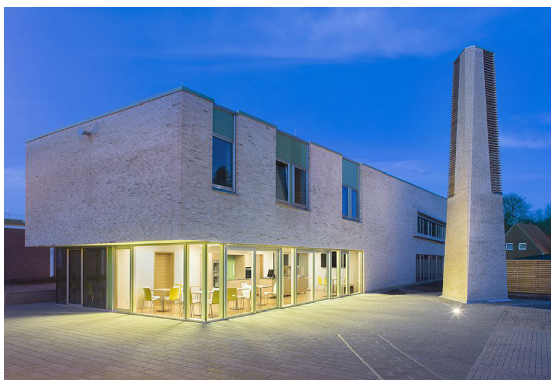
Kirche am Campus