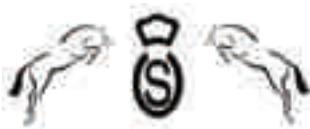
Springferdezuchtverband Oldenburg International